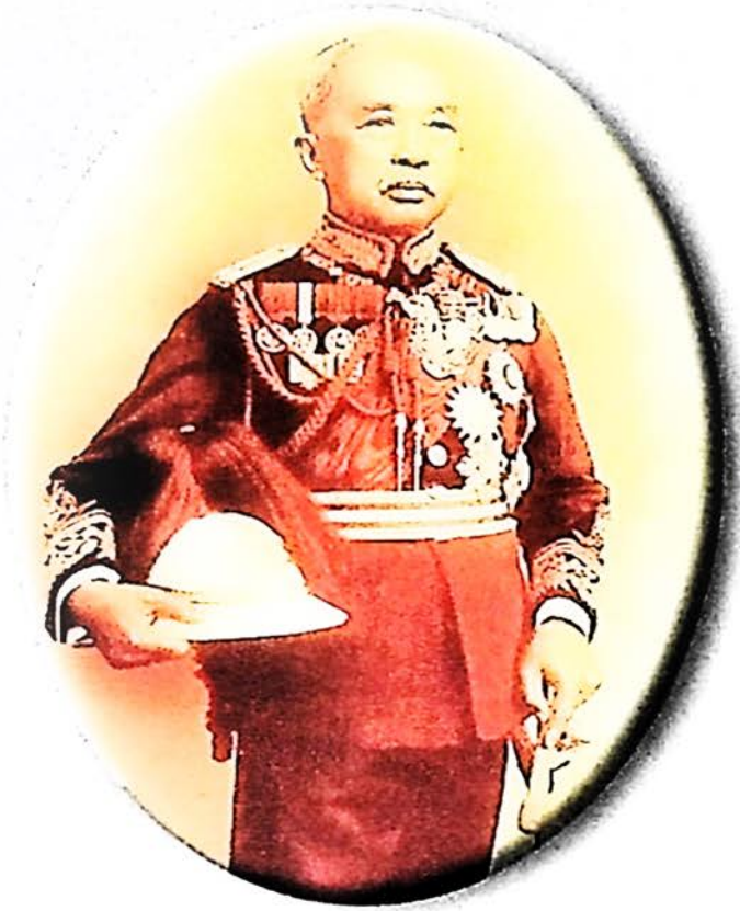
สมเด็จพระยาดำรงราชานุภาพ เสนาบดีกระทรวงมหาดไทย 2435 - 2458

“...เจ้าคุณ อำนาจอยู่ที่ราษฎรเชื่อถือ ไม่ใช่อยู่ที่พระแสงราชสัตรา จะไปอยู่ที่ไหนก็ตาม ถ้าเจ้าคุณทำให้ราษฎรเชื่อถือด้วยความศรัทธาแล้ว ไม่มีใครถอดเจ้าคุณได้แม้ในหลวง เพราะว่าท่านก็คงปรารถนาให้ราษฎร อยู่เย็นเป็นสุขเช่นเดียวกัน...”